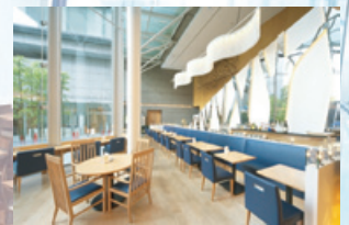
レストラン「ジャルダン」