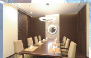
レストラン個室「雅」